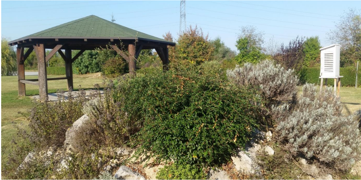
Slika 14. Meteorološka kućica i sjenica