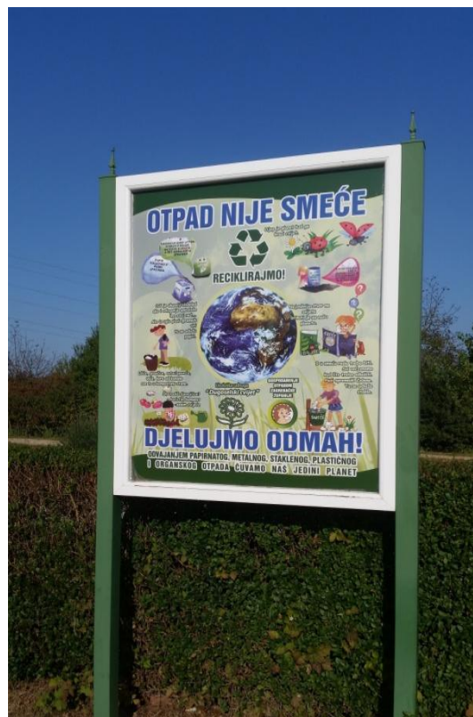
Slika 15. Znak s informacijama o recikliranju