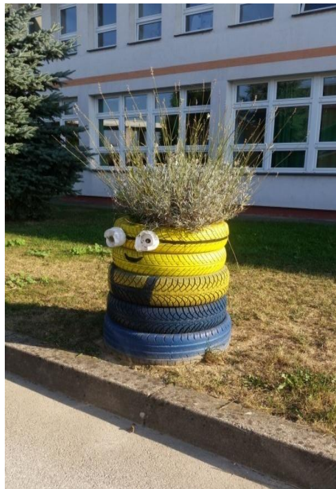
Slika 13. Posude za cvijeće od gume