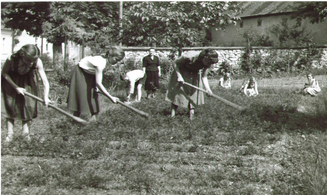
Slika 2. Školski vrt Ivanec, kraj 40-ih godina 20. stoljeća.

Na Slici 2. vidljiv je školski vrt kojeg obrađuju učenice pod mentorstvom učiteljice.